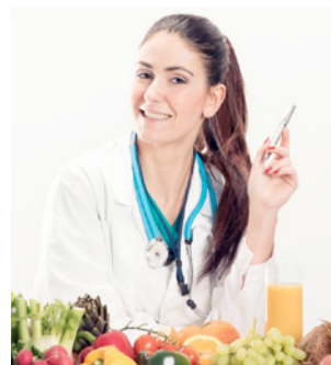
โภชนาการ