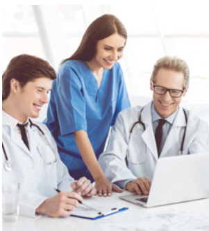
สถานพยาบาล