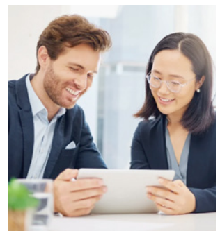
ศูนย์สุขภาพ